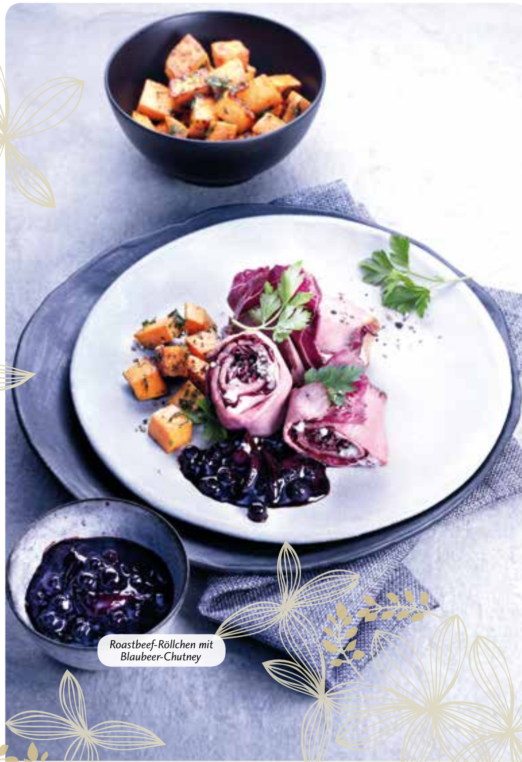
Roastbeef-Röllchen mit Blaubeer-Chutney