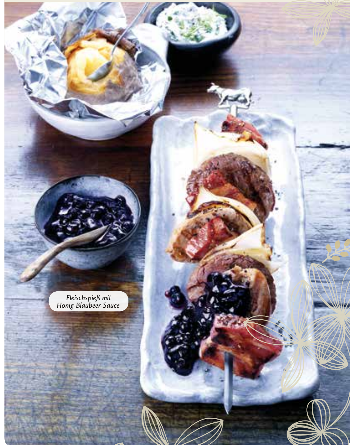
Fleischspieß mit Honig-Blaubeer-Sauce

Nicht nur geschmacklich überzeugen wilde Blaubeeren aus Kanada. Die Wildfrüchte liefern viele wichtige Nährstoffe: Sie haben einen hohen Ballaststoffgehalt und unter der tiefblauen Schale stecken die Vitamine C, E und verschiedene B-Vitamine sowie die Mineralstoffe Kalium, Magnesium und Eisen.