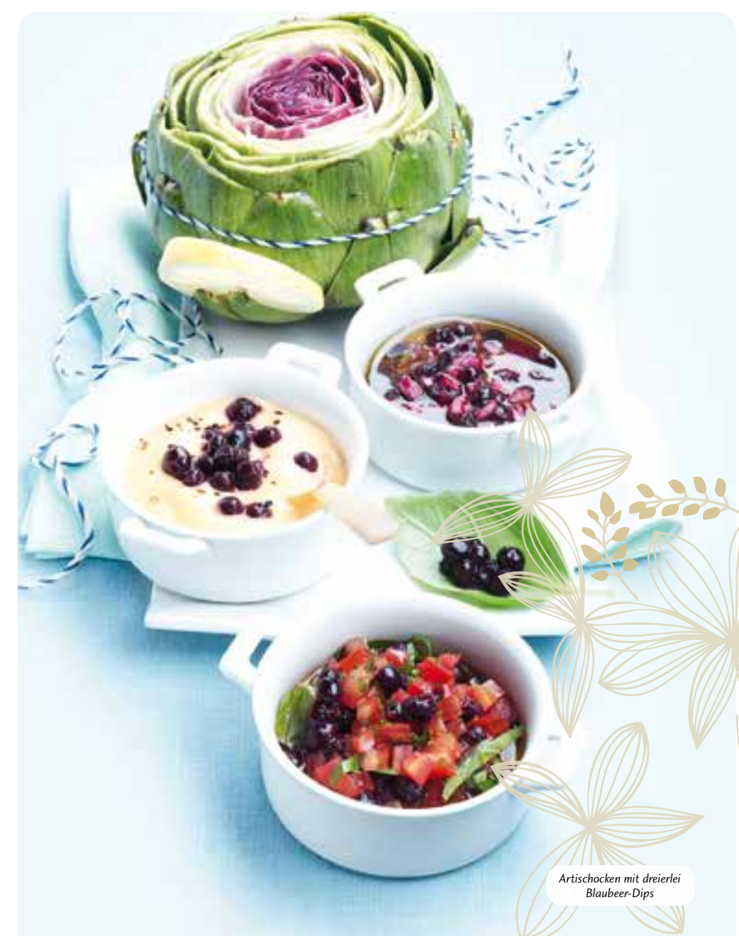
Artischocken mit dreierlei Blaubeer-Dips

Raffinierte Rezepte für den Alltag Ohne viel Aufwand zubereitet sind Flammkuchen mit wilden Blaubeeren, kleine Frikadellen mit einem leichten Blaubeer-Gurken-Salat oder Milchreis mit Blaubeerkompott. Ideal für ein leichtes Mittagessen.