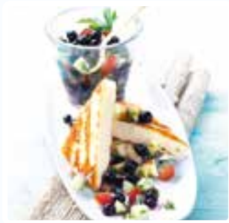
Halloumi mit Tomate-Blaubeer-Salat