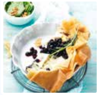
Ziegenkäse-Tarte mit wilden Blaubeeren