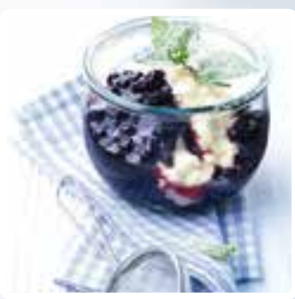
Milchreis mit Blaubeerkompott