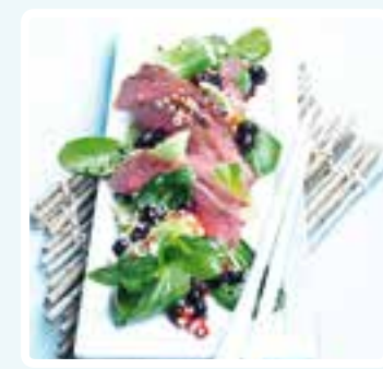
Asiatischer Salat mit wilden Blaubeeren