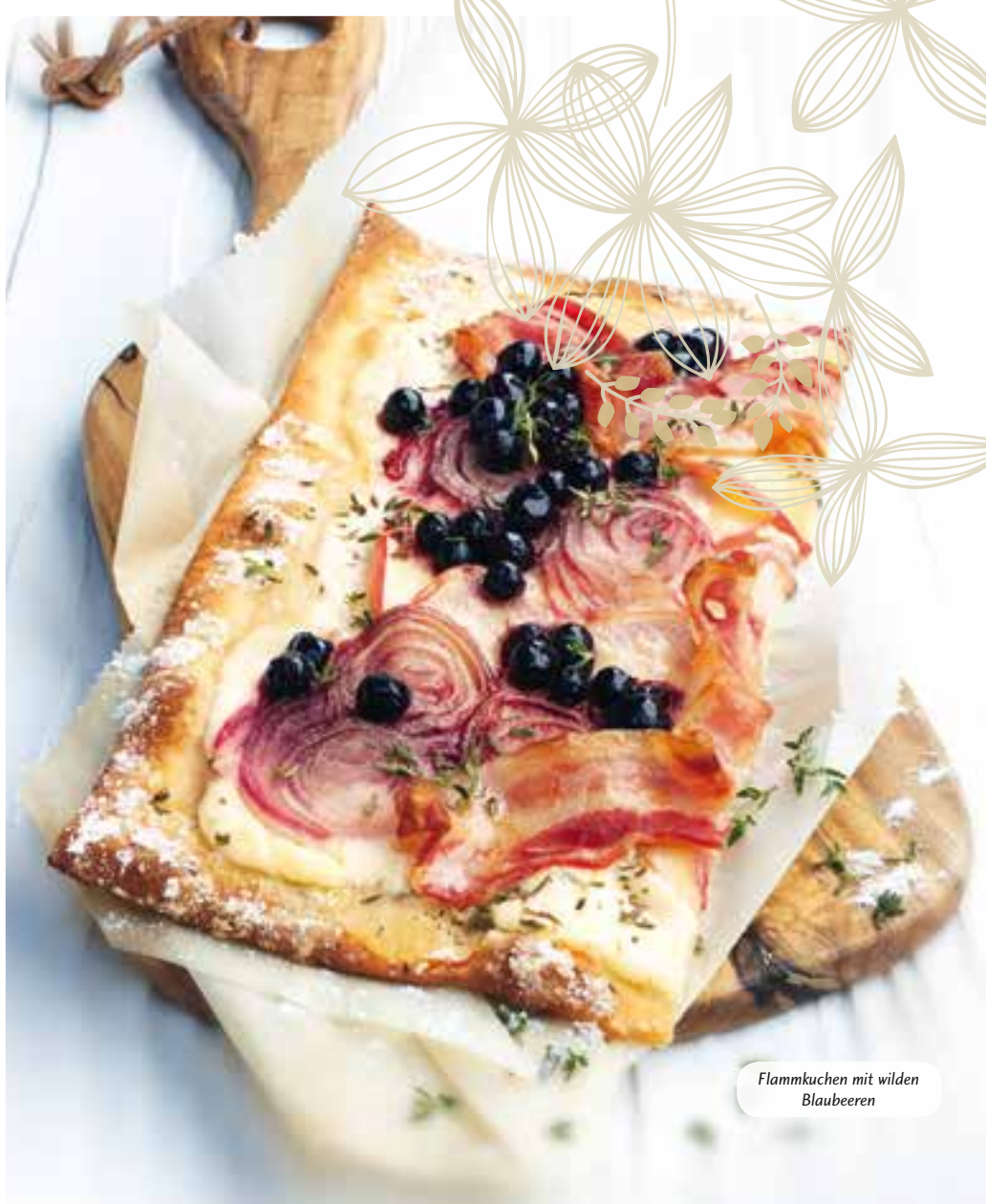
Flammkuchen mit wilden Blaubeeren