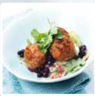
Mini-Frikadellen mit Blaubeer-Gurken-Salat